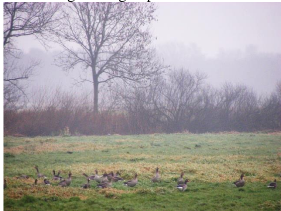
Grauwe – en kolganzen polder Lappenvoort G.J.

Druilerig, donkerig is het als de 10 deelnemers elkaar ontmoeten op de P bij 't Friescheveen. Aan de andere kant van het dijke scharrelen kolganzen en er boven vliegt een aalscholver door een grijs waas. Wellicht dezelfde, die we iets verder bovenin een els de veren zien drogen(?) in de miezerregen. Mezen begeleiden ons als we afdalen naar de plas en ook de roodborst laat zich horen. Op de plas is het vanuit deze hoek erg stil en grijs maar sijsjes en staartmezen vergoeden veel. We horen een waterral knorrig schreeuwen. Onder een omgewaaide boom ligt een mooi palet oud blik, overblijfsel van vroegere vuilstort en daarom heet dit deel ook Het Blik. Een ander overblijfsel daarvan is de prachtframboos, die we in het voorjaar vaak zien bloeien. Vanuit de hut zien we wilde -, kuif-, slob- en krakeenden. Over de dijk van het sterk verruigde poldertje vliegt een sperwer laag de bosschages in en laten grauwe – en kolganzen zich goed zien in polder Lappenvoort. En een buizerd zweeft er tussen de kale bomen. De beloofde ijsvogels zagen we pas na de koffie in enkelvoud en in glas in lood binnen bij de familie Dubois.