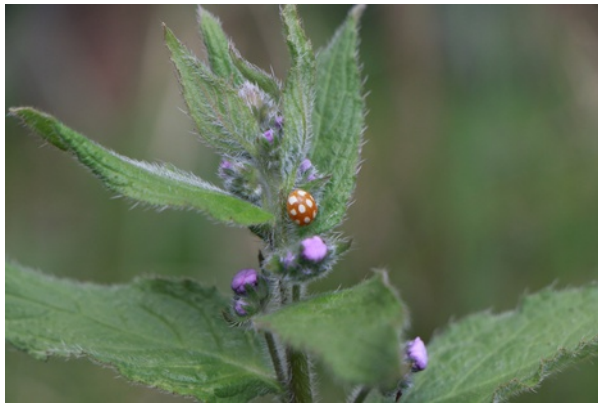
. Roomvlek lieveheersbeestje