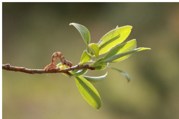
. Spanrups wintervlinder