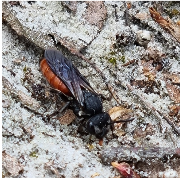
. Grote Bloedbij