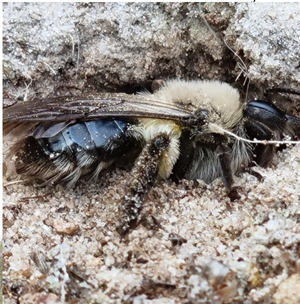
. Grijze zandbij